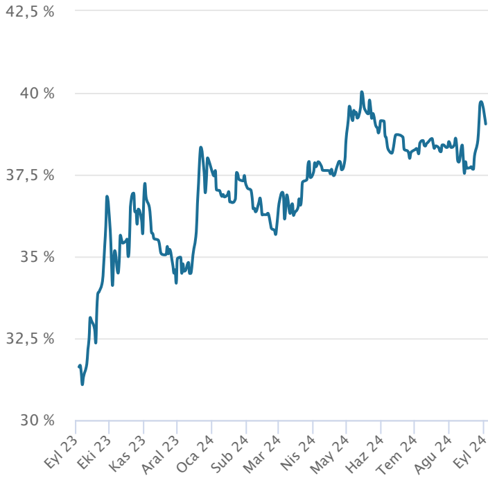
Yabancı Takas Oranı