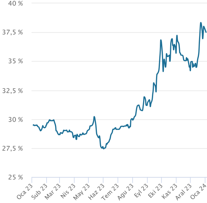
Yabancı Takas Oranı