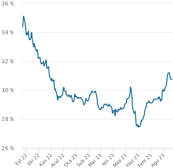
Yabancı Takas Oranı