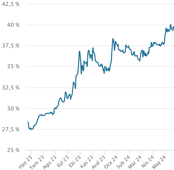
Yabancı Takas Oranı