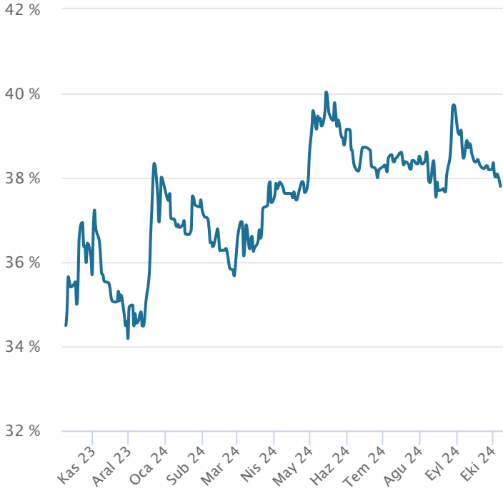
Yabancı Takas Oranı