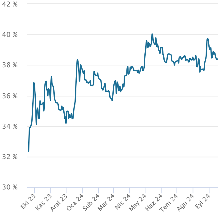
Yabancı Takas Oranı