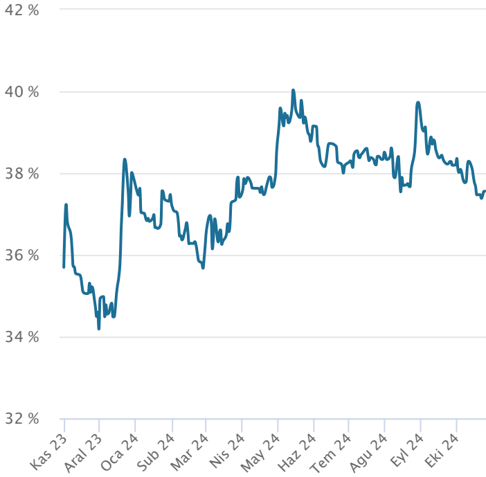
Yabancı Takas Oranı